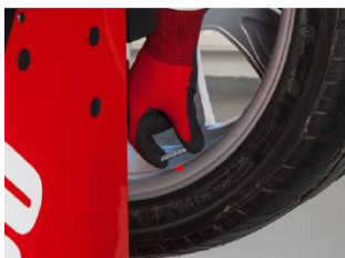
Smart Sonar pro šířku disku