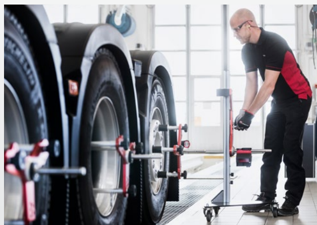
Bezdotykový rám a snímací zařízení

Postup změření kol se řídí animačním software, který minimalizuje všechny možné chyby obsluhy. Nezáleží na tom, jak jste zkušený, s i-track II můžete být mistrem v geometrii kol.