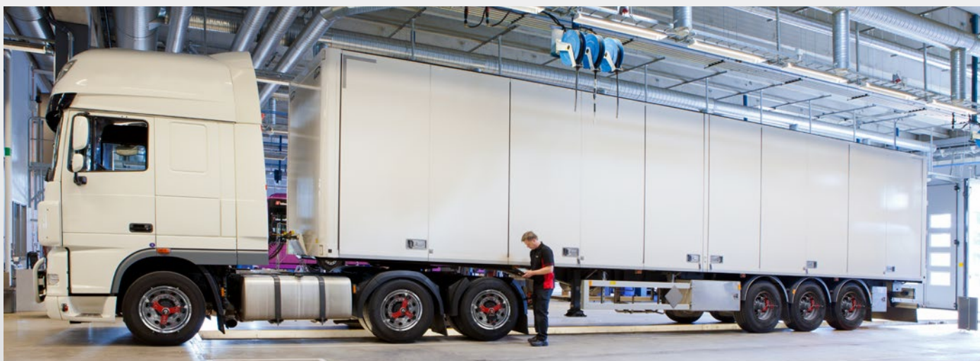
Zaměřování kompletní sestavy vozidla s návěsem